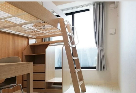
家具付きの居室はプライバシーが確保された個室