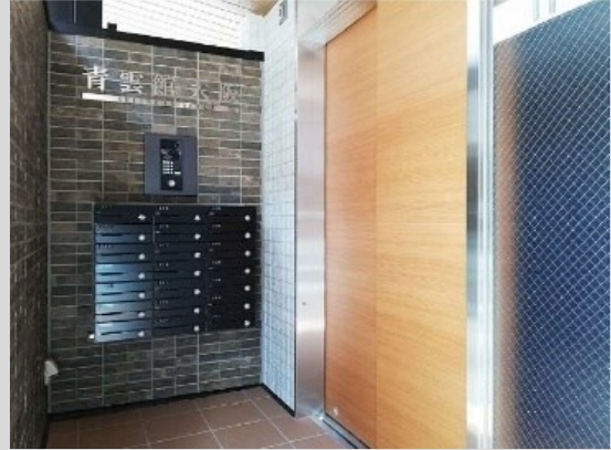
セキュリティを重視したオートロックのエントランス