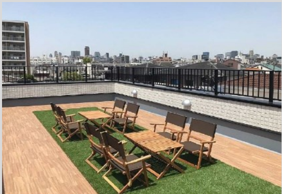
気分転換できる、開放的な屋上テラス